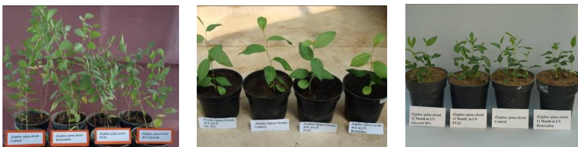
شکل ۲: استقرار و رشد نهال‌های حاصل از یک هفته، یک ماه و یک سال ذخیره‌سازی در نیتروژن مایع با پیش تیمارهای مختلف همراه با شاهد در شرایط گلخانه